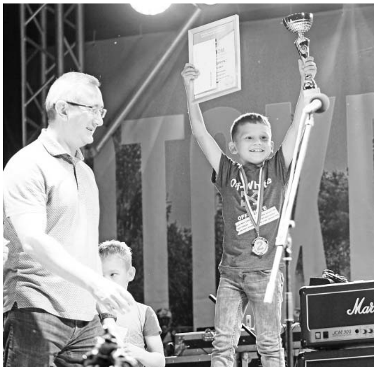
Первыми награждали малышей.